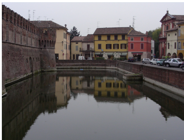
Slottet i Fontanellato

Kvällens middag intas vid vallgraven runt slottet i Fontanellato .