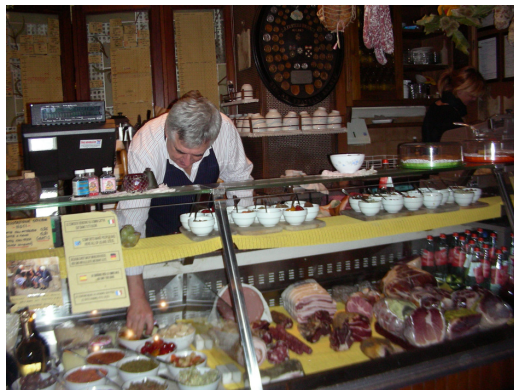
La Salsamenteria i Busseto

Ons 1/10 Denna dag besöker vi Verdis barndomshem i Roncole, Busseto. Vi beser den lilla teatern och äter en lätt lunch på en karaktäristisk liten restaurang helt i Verdistil – Salsamenteria .