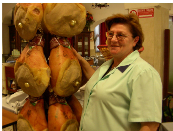
Parmaskinkan – alltid på meny

Vi njuter av god mat gjord på lokalproducerade råvaror och bekantar oss med framställningen av ost och skinka.